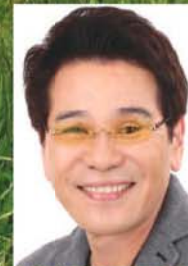
ピーコ ファッション評論家 シャンソン歌手